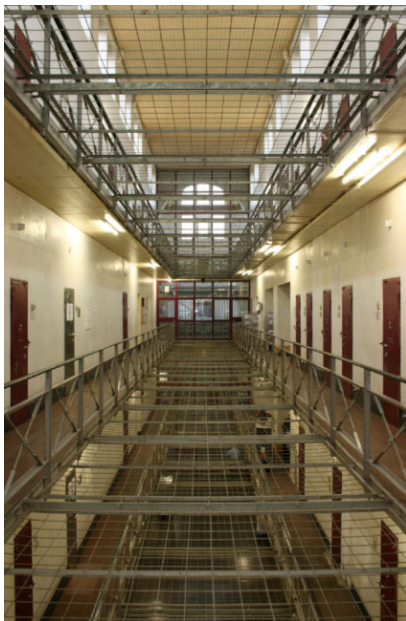
Zellentrakt der JVA Mannheim